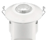
Dækker ø8m Type-Nr.: 28002801