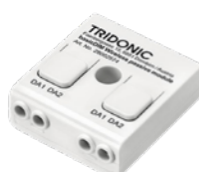
DALI output som forsynes fra DALI bussen Type-Nr. 28002574