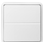
2 taster Type nr.: J100203