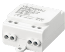
Både DALI, 1-10V, og relæ output. Har indbygget strømforsyning. Type-Nr. 28002212