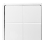
4 taster Type nr.: J100607